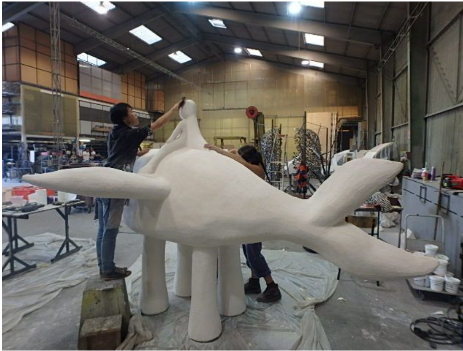
Réalisation- BÔ - Le Jardin Imaginaire août 2018

Réalisation collaborer avec Société PRELUD