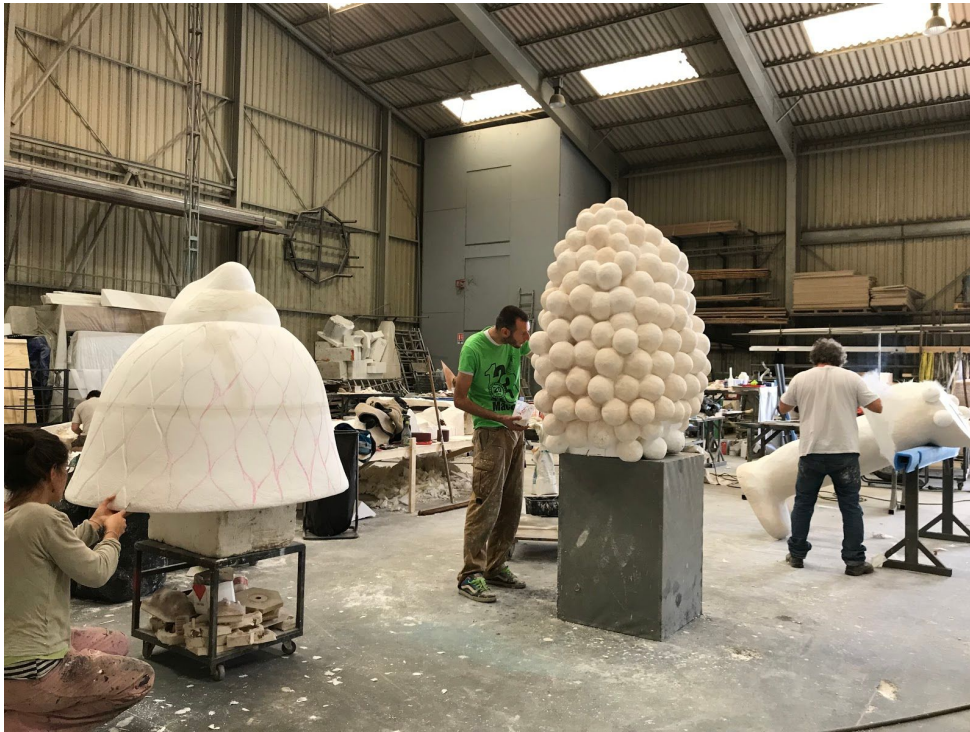
Réalisation- BÔ - Le Jardin Imaginaire août 2019

Réalisation collaborer avec Société PRELUD